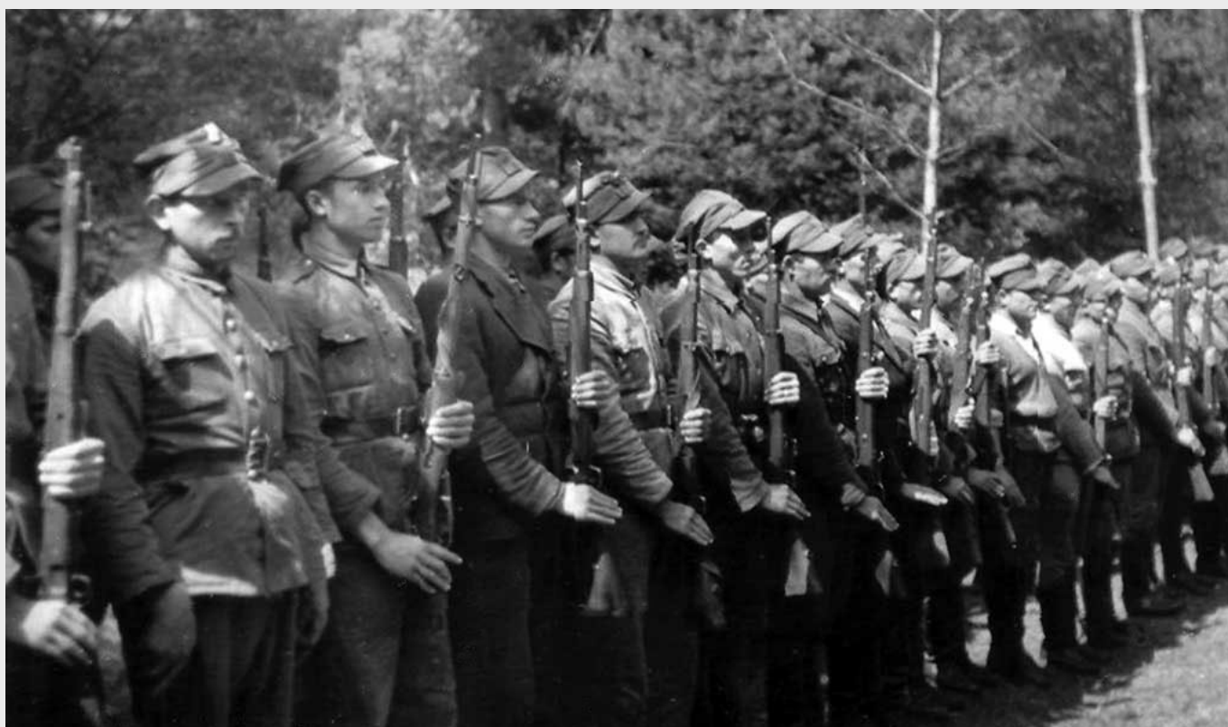
Kurs podoficerski Obwodu Tomaszów Lubelski AK-DSZ, wiosna 1945 r.