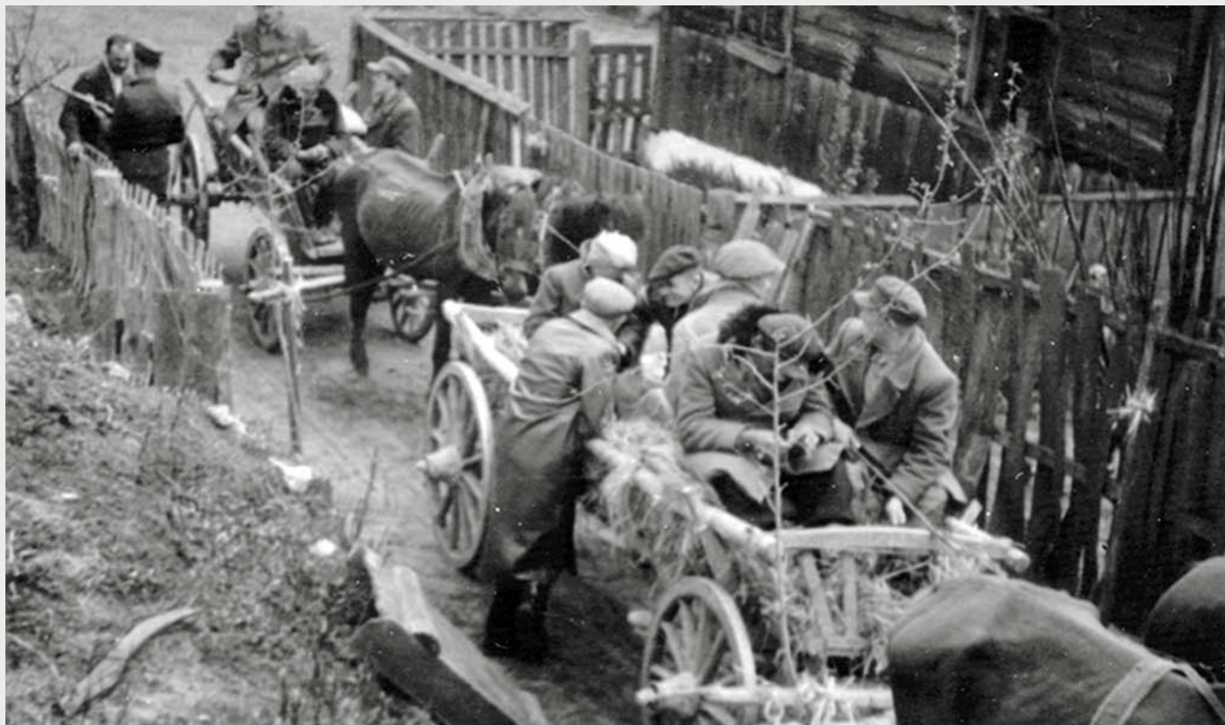
Dowództwo Obwodu Tomaszów Lubelski AK-DSZ w drodze na odprawę, kwiecień-maj 1945 r.