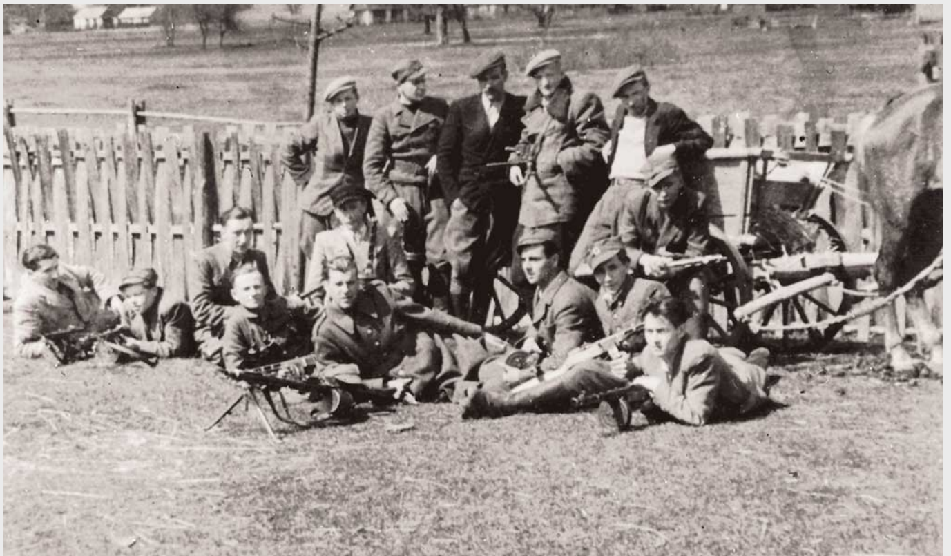
Żołnierze oddziału dyspozycyjnego kompanii „Narol” V Rejonu Obwodu Tomaszów Lubelski AK-DSZ, Huta Różaniecka, pow. Lubaczów, maj 1945 r.