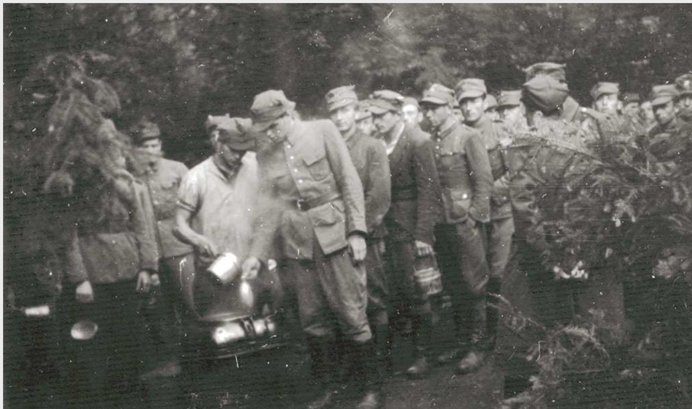
Kurs młodszych dowódców piechoty Obwodu Tomaszów Lubelski AK-DSZ, maj 1945 r.