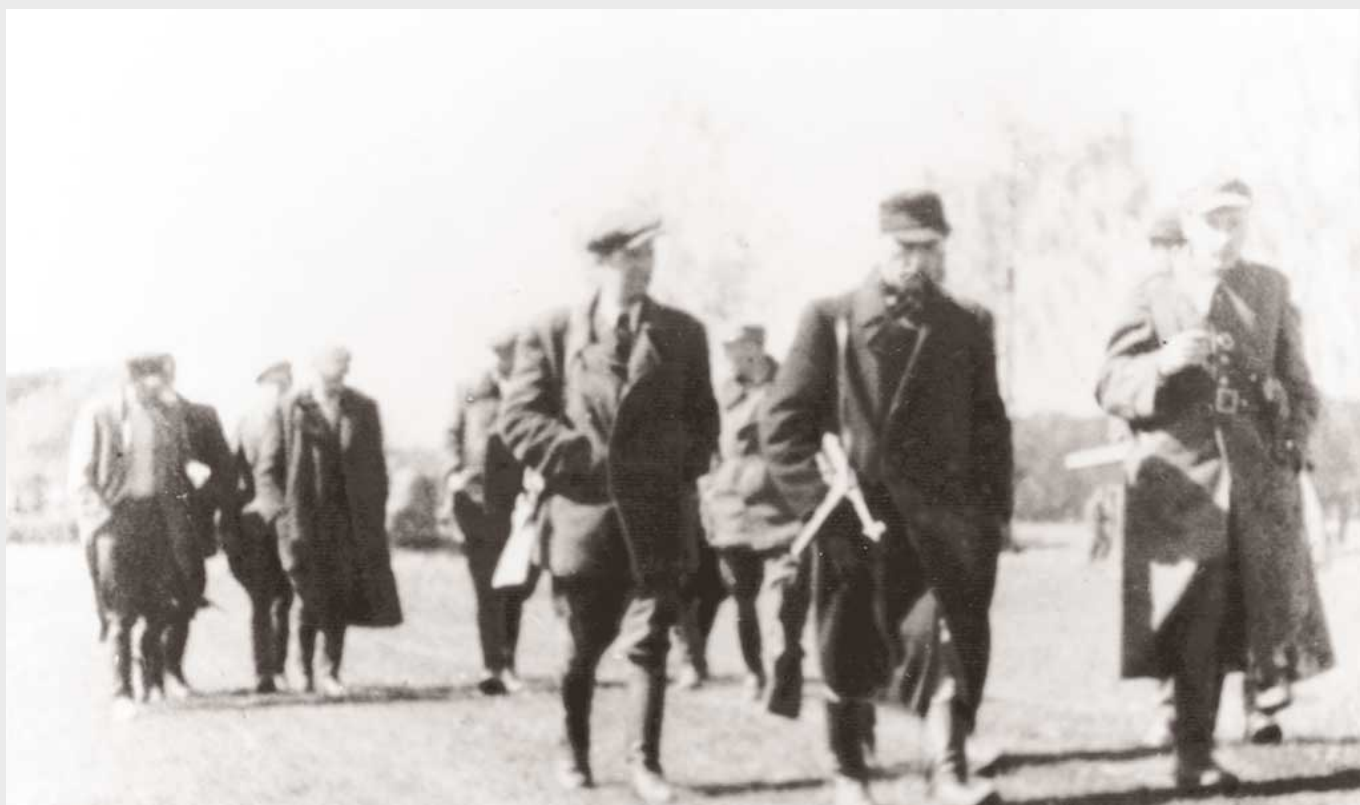
Odprawa kadry dowódczej Inspektoratu Zamość AK-DSZ, Huta Różaniecka, pow. Lubaczów, maj 1945 r.