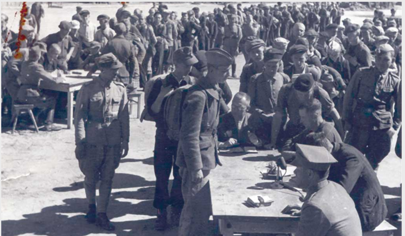
Żołnierze 27. Wołyńskiej Dywizji Piechoty AK oraz Okręgu Lublin AK internowani w obozie