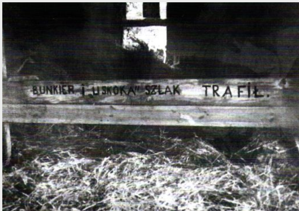
Napis sporządzony przez funkcjonariuszy UB na jednej z desek zapalnicy po zakończeniu operacji w Dąbrówce, 21 V 1949 r.

budynku administracyjnego na Zamku w Lublinie.